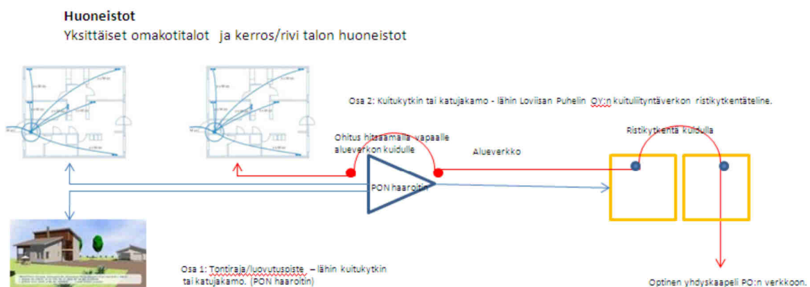
Kuva 1: Optinen tilaajayhteys