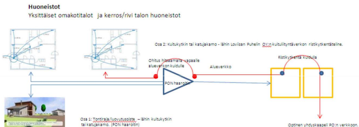
Kuva 1: Optinen tilaajayhteys